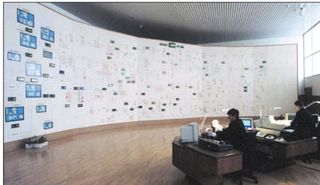
Диспетчерский зал ОДУ Северо-Запада в Ленинграде в начале 1990-х годов

Понятно, что решить все проблемы обеспечения надёжного функционирования параллельной работы энергосистем вновь образованного межгосударственного энергообъединения за короткое время было невозможно. На первых порах огромную роль играли сложившиеся за годы товарищеские взаимоотношения руководителей ЦДУ ЕЭС с руководством диспетчерских центров энергосистем новых стран, а также продолжение существовавшей со времён Советского Союза практики эксплуатации оборудования электростанций и сетей, несмотря на то, что советская нормативно-техническая база электроэнергетики канула в лету вместе с СССР.