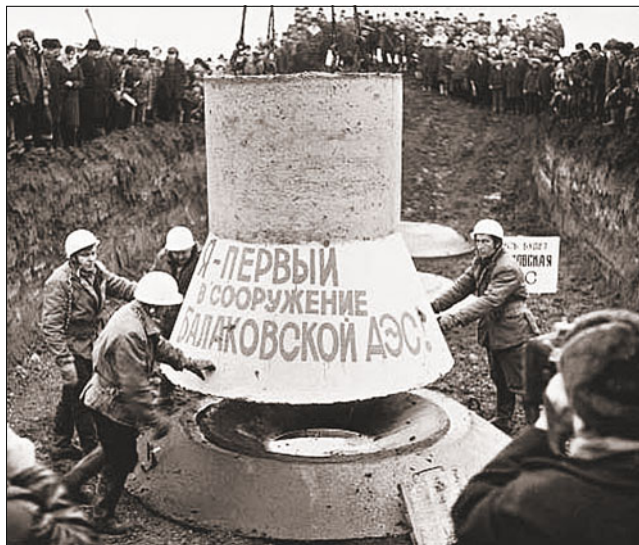
Блок № 4 Балаковской АЭС установленной мощностью 1000 МВт (начал работу в 1993 г., стал крупнейшим вводом десятилетия). На фото: торжественная закладка фундамента, 1980 г.

были созданы в подавляющем большинстве диспетчерских центров.