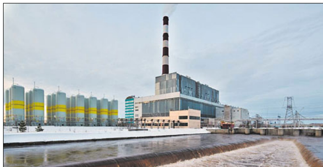
Блок № 1 Нижнеартовской ГРЭС установленной мощностью 800 МВт (введён в работу в 1993 г., после чего строительство станции было надолго законсервировано)

После первого отделения параллельную работу с ОЭС Украины многократно восстанавливали, но по тем же причинам приходилось снова и снова её прерывать – в 1995, 1996, 1997 и 1998 гг.