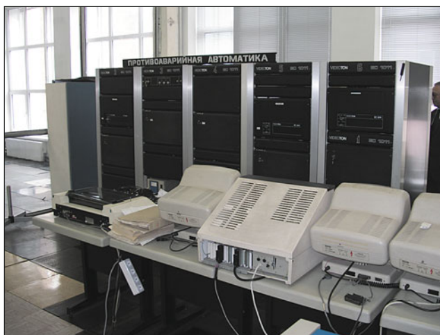
ЭВМ “Видеотон” ЕС-2011, на базе которых в 1990-е работали централизованные системы противоаварийной автоматизации объединённых энергосистем

В этот же период началось сооружение волоконно-оптических линий связи (ВОЛС) и внедрение цифровых каналов связи, благодаря которым существенно увеличился объём передаваемой информации с энергообъектов в диспетчерские центры и повысилось качество диспетчерских телефонных каналов связи – новые коммутаторы, обладающие большими функциональными возможностями, значительно облегчили напряжённую работу диспетчеров. Первую ВОЛС внедрили в Ленэнерго в 1989 г., а за следующее десятилетие в энергосистемах было построено около 7000 км ВОЛС с подвеской на ЛЭП напряжением от 110 до 330 кВ.