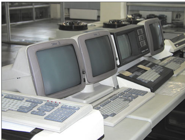
Рабочее место оператора ЭВМ “Видеотон” ЕС-2011

В 1990-х, несмотря на хроническое недофинансирование, в основной сети ЕЭС началось внедрение новых перспективных устройств РЗА, выполненных на микропроцессорной базе, а также цифровых осциллографов и регистраторов аварийных событий. Постоянно совершенствовались программное обеспечение и технические средства центральной координирующей системы АРЧМ.