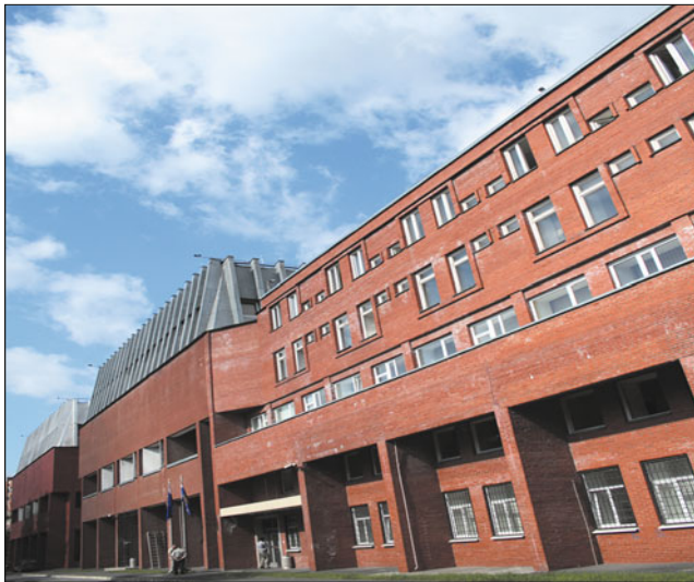
Здание ОДУ Северо-Запада в Санкт-Петербурге

а энергоснабжение Псковской обл. зависело от работы энергосистем Беларуси и Латвии. Получалось, что энергосистемы соседних государств имели возможность ограничить или прекратить транзит электроэнергии в отдельные регионы России.