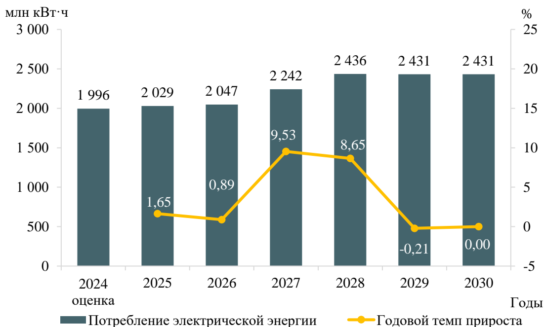
Рисунок 3 – Прогноз потребления электрической энергии по территории Еврейской автономной области и годовые темпы прироста

Изменение динамики потребления электрической энергии по территории Еврейской автономной области и годовые темпы прироста представлены на рисунке 3.