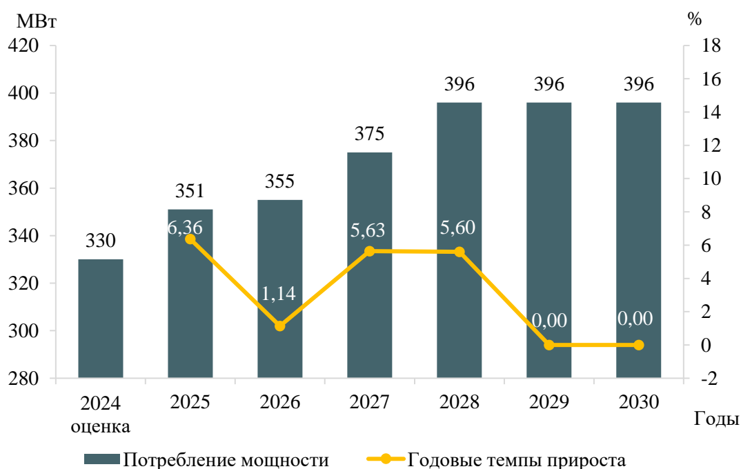
Рисунок 4 – Прогноз потребления мощности на территории Еврейской автономной области энергосистемы Хабаровского края и Еврейской автономной области и годовые темпы прироста

Динамика изменения потребления мощности на территории Еврейской автономной области энергосистемы Хабаровского края и Еврейской автономной области и годовые темпы прироста представлены на рисунке 4.