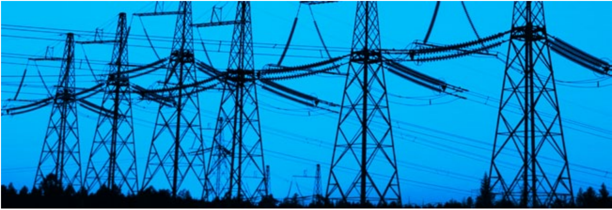
СХЕМА ВЫДАЧИ МОЩНОСТИ (СВМ)